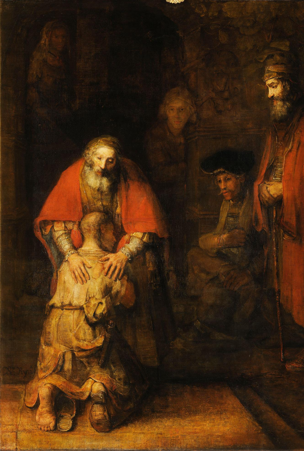
Ritorno del figliol prodigo, Rembrandt

La comunione familiare può essere conservata e perfezionata solo con un grande spirito di sacrificio, esige infatti una pronta e generosa disponibilità di tutti e di ciascuno alla comprensione, alla tolleranza, al perdono, alla riconciliazione.